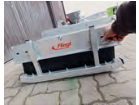
Über die verstellbaren Einstellhilfen begrenzt man den Druck auf den Besen.