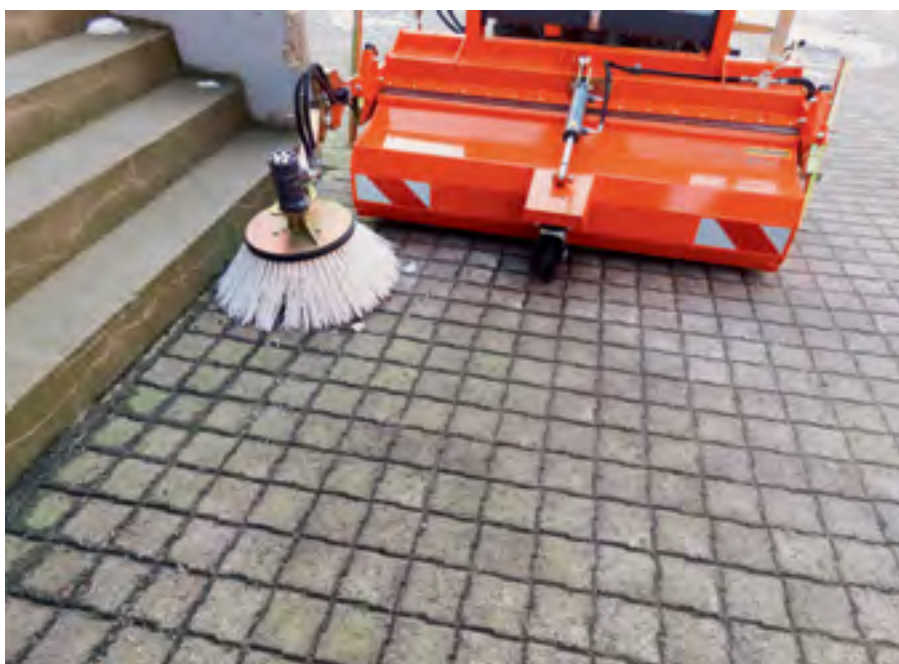
Mit dem Seitenbesen lassen sich auch enge Stellen zukehren.