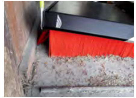
Die seitlichen Auffangbürsten erlauben auch ein sauberes Kehren einer Wand entlang.