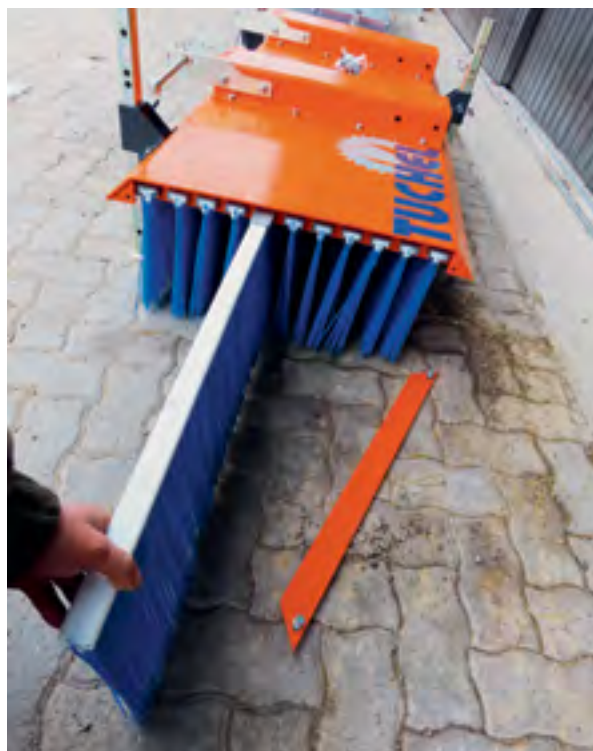
Die einzelnen Bürstensegmente lassen sich einfach herausziehen und auswechseln.