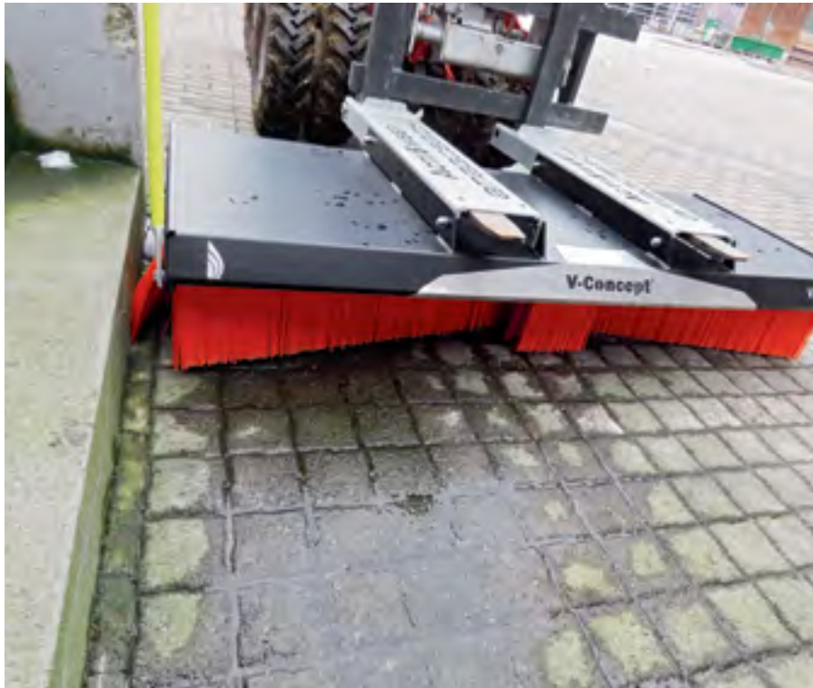
Mit den V-förmigen Bürsten vorne wird das Material vor der Maschine gehalten.