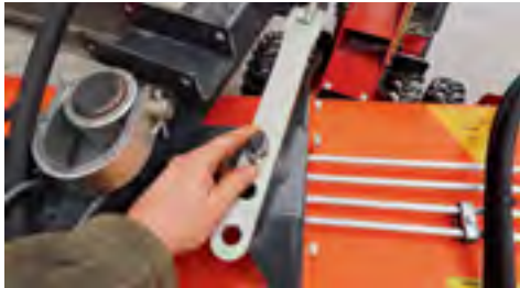
Der Schwenkmechanismus ist mechanisch verstellbar.