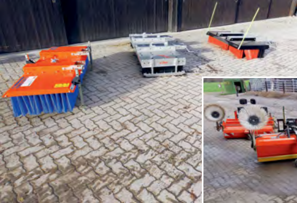
Die sechs Wischmaschinen im Test: Links die Schiebebesen, rechts die Kehrbürsten mit hydraulischem Antrieb.