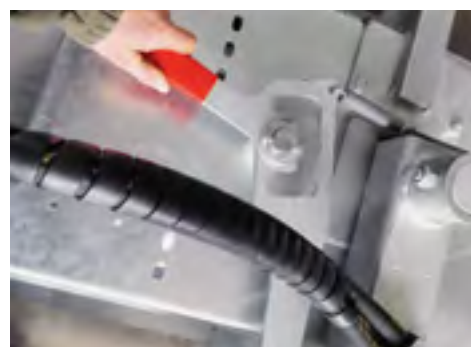
Über eine einfache Rasterung lässt sich die Maschinen um je 30° schwenken.