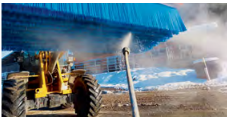
Die Reinigung der Maschine sowie der Bürsten ist einfach und lässt sich schnell erledigen.