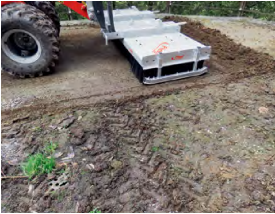
Auch viel feuchtes Material macht dem «Löwen» nichts aus.