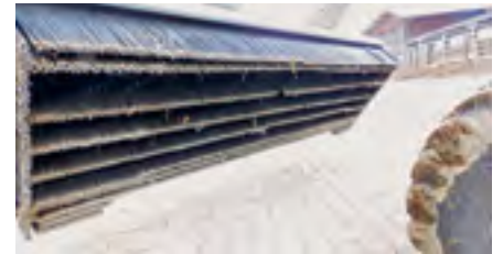
Blick auf die Unterseite mit harten Borsten und Randbürsten.