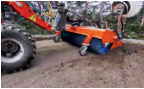
Nahe angebrachte Stützräder sorgen für eine saubere Aufnahme.