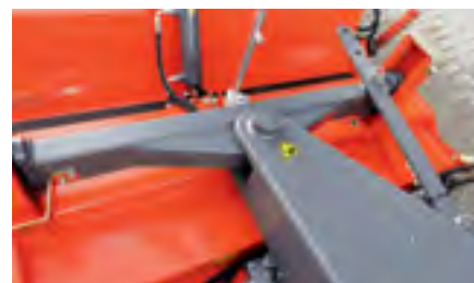
Der 3D-Rollenausgleich ermöglicht eine Boden Anpassung auf alle Seiten.