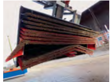
Die roten Bürsten sind für den groben Schmutz, die schwarzen für den Staub.