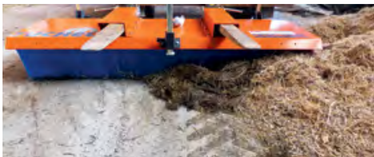
Der Schiebebesen kommt mit unterschiedlichem Material gut zurecht.