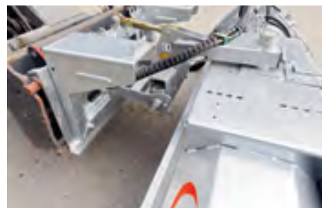
Dank Parallelogramm mit Teleskopoberlenker ist die Boden Anpassung ideal.