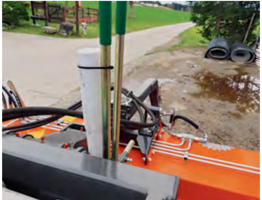
Gut einsehbar ist die Positionsanzeige auf der Maschine.