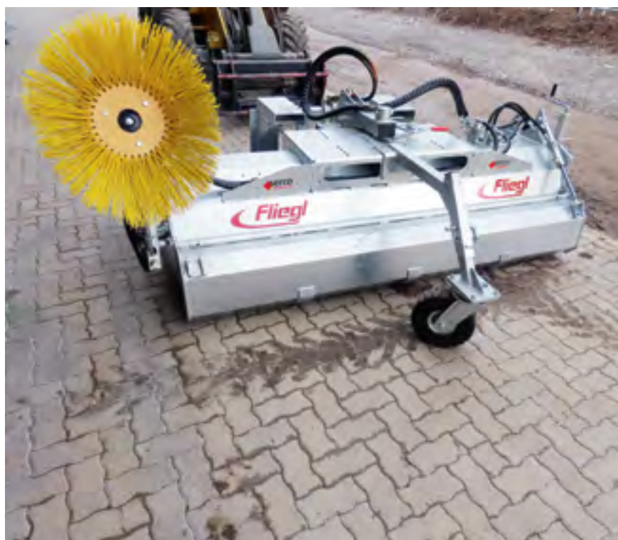
Fliegl «Typ 600» ist mit massiven Stützrädern ausgerüstet.